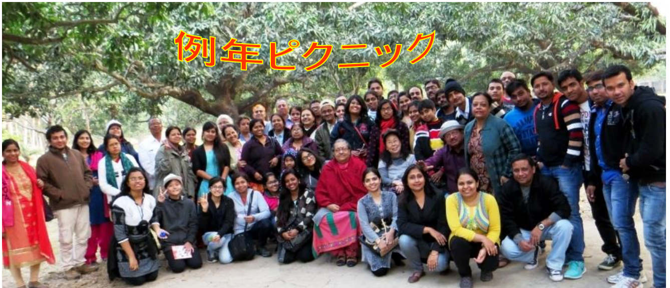
自然を楽しんでいる NKK のメンバー

しずせ 沈む瀬あれば うえ 浮かぶ瀬あり Life has its ups and downs