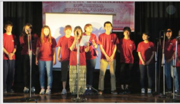
"The Telegraph Calcutta" T2 2016年4月8日をご覧になって下さい